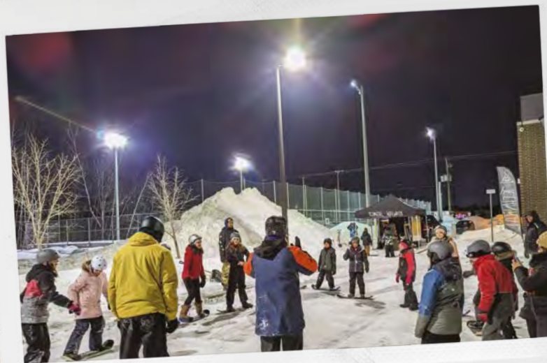
LE TEMPS DE LA RELÂCHE !