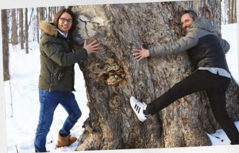
LE PLUS GROS ÉRABLE